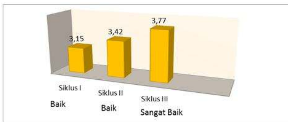
Grafik 4. Grafik Kegiatan Pembelajaran dalam strategi IOC

Hasil observasi kegiatan pembelajaran menunjukkan adanya peningkatan jika dibandingkan dengan pembelajaran yang dilakukan secara konvensional, dapat dilihat pada tabel di bawah ini.