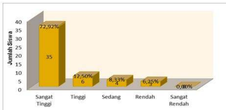
Grafik 3. Tes Hasil Belajar Siklus III

Berdasarkan hasil perhitungan menunjukkan bahwa nilai ketuntasan belajar siswa pada siklus III mencapai 93,75%, sehingga dapat dikatakan bahwa siklus III sudah menunjukkan hasil yang ingin dicapai dari proses penelitian. Dari data diatas dapat digambarkan dalam grafik batang dibawah ini.