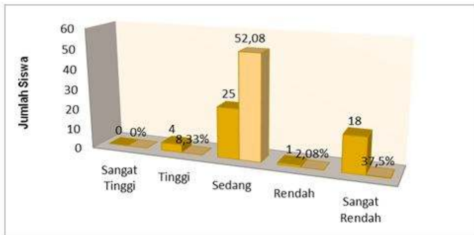
Grafik 1. Tes Hasil Belajar Siklus I

bahwa siklus I masih kurang menunjukkan hasil yang ingin dicapai dari proses penelitian. Dari data diatas dapat digambarkan dalam grafik batang dibawah ini.